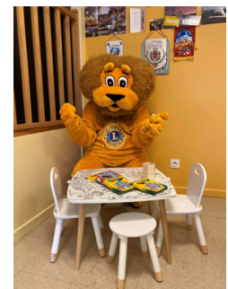
Léo la Mascotte du Club Lions Avenir aime aussi ce concept et colorie.