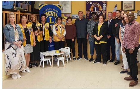
Les membres du Club Lions Avenir et les heureux récipiendaires de Saint-Pierre.