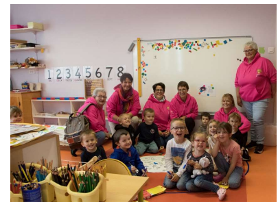
Photo de groupe des membres du Club Lions Avenir et des enfants de l'Ecole de Miquelon.