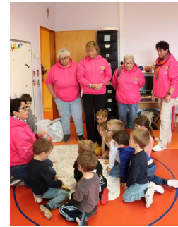
Découverte des « Drôles de Bouilles » par les enfants de l'Ecole Maternelle de Miquelon.